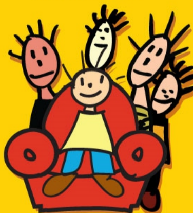
RECHT OM BIJ JE FAMILIE TE ZIJN