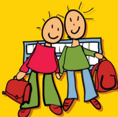
RECHT OP ONDERWIJS