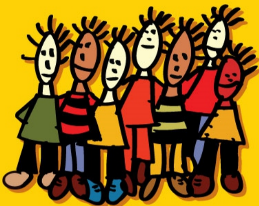
RECHT OP SAMENKOMEN