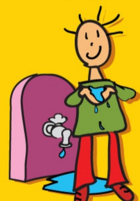
RECHT OP WATER