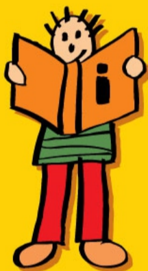
RECHT OP INFORMATIE