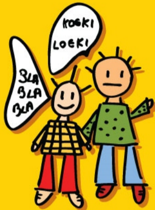
RECHT OP EEN EIGEN MENING