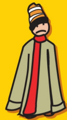
RECHT OP KLEDIJ