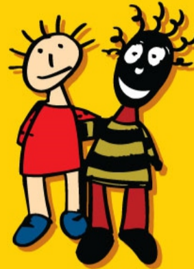
IEDEREEN IS GELIJK