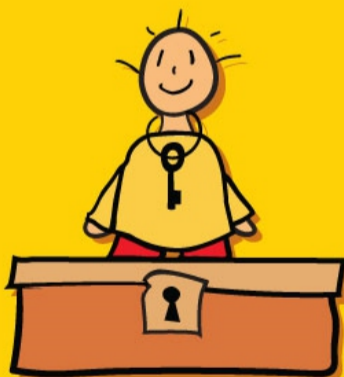
RECHT OP PRIVACY