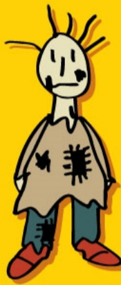
RECHT OP BESCHERMING