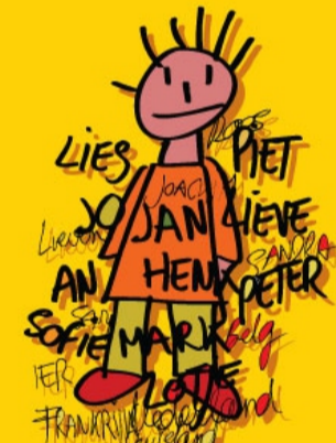
RECHT OP EEN NAAM