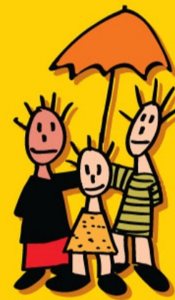
RECHT OP ZORG EN LIEFDE