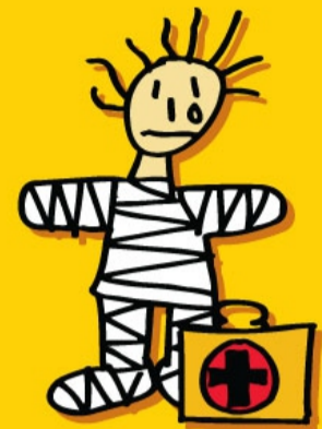
RECHT OP VERZORGING