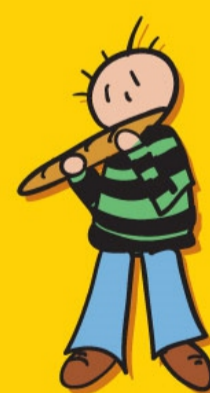
RECHT OP VOEDING