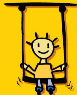
RECHT OP SPEL