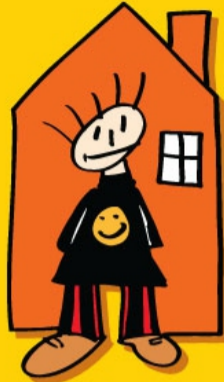
RECHT OP WONEN